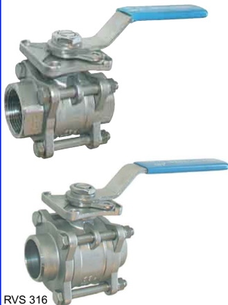
RVS 316 3-delig - volle doorlaat - iso 5211-top flens fig 177 : PN63 1/4"-4" bsp fig 178 : PN63 1/4"-4" BW fig 177NPT : PN63 1/4"-4" npt fig 178SW : PN63 1/4"-4" SW