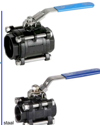
staal fig 167 : PN63/40 1/4"-4" bsp fig 168 : PN63/40 1/4"-4" BW fig 167NPT : PN63/40 1/4"-4" npt fig 168SW : PN63/40 1/4"-4" SW