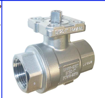
RVS 316 volle doorlaat - iso 5211 montageflens fig 171VEGA 1/4"-1" bsp : PN140 1 1/4"-2" bsp : PN100 2 1/2"-3" bsp : PN64 voorzien van iso 5211-top flens voor rechtstreekse montage