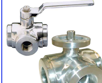
RVS 316 volle doorlaat fig 189L : 1/2"-2" bsp L-boring fig 189T : 1/2"-2" bsp T-boring voorzien van iso 5211-top flens voor rechtstreekse montage fig 188L : 1/2"-2" bsp met hendelbediening fig 188T : 1/2"-2" bsp met hendelbediening