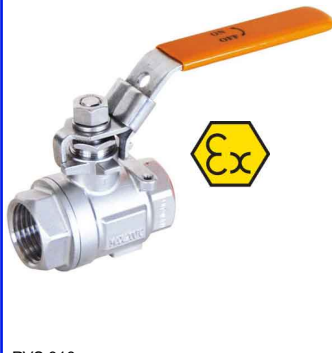
RVS 316 2-delig - volle doorlaat - PN63 - 200°C fig 171T HT : PN63 1/4"-2" bsp