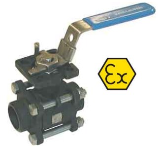
staal 3-delig - volle doorlaat - iso 5211-top flens fig 167T : PN63/40 1/4"-4" bsp fig 168T : PN63/40 1/4"-4" BW fig 168T SW : PN63/40 1/4"-4" SW