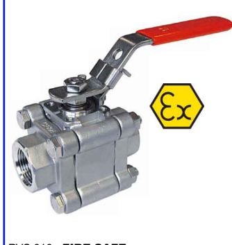
RVS 316 - FIRE SAFE 3-delig volle doorlaat - PN140/100 - 220°C fig 177T HT : PN140/100 1/4"-2" bsp fig 178T HT : PN140/100 1/4"-2" BW fig 177T HT NPT : PN140/100 1/4"-2" npt fig 178T HT SW : PN140/100 1/4"-2" SW