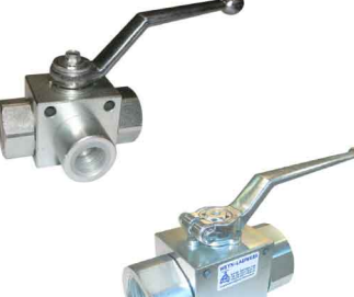
staal - hoge druk blokkogelkraan - gereduceerde boring fig 133 : 3-weg / L-boring 1/4"-3/8" bsp PN400 1/2"-1" PN350 -10 +100°C fig 169 : 2-weg / 1/4"-2" bsp PN500/315 -10 +100°C