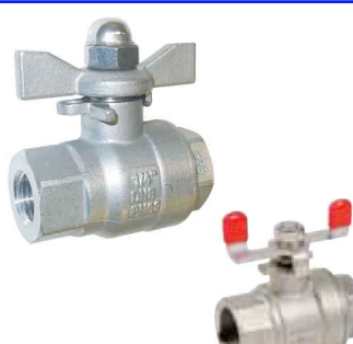
RVS 316 2-delig - volle doorlaat - vleugelhendel fig 171G BF : PN63 1/4"-1" bsp FF fig 171G BF MF : PN63 1/4"-1" bsp MF fig 171BF : PN63/16 1/4"-1" bsp FF