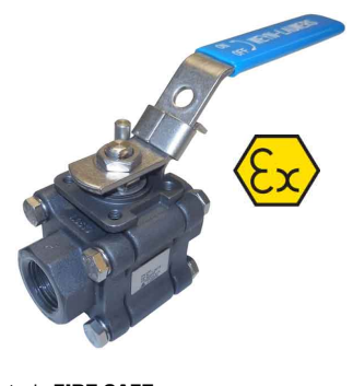
staal - FIRE SAFE 3-delig - volle doorlaat - PN140/100 - 220°C fig 167T HT : PN140/100 1/4"-2" bsp fig 168T HT : PN140/100 1/4"-2" BW fig 167T HT NPT : PN140/100 1/4"-2" npt fig 178T HT SW : PN140/100 1/4"-2" SW