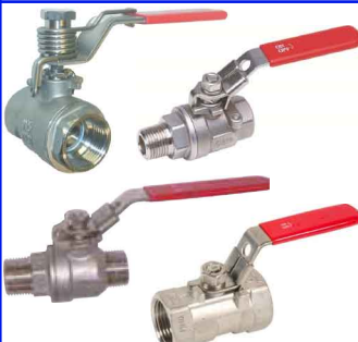
RVS 316 fig 170 : gereduceerd PN40 1/4"-2" bsp fig 171MF : gereduceerd PN63/40 1/4"-2" bsp fig 171MM : gereduceerd PN63 3/8"-1" bsp fig 171NPT : volle doorl. PN63/40 1/4"-2" npt fig 171SR : veersluitend 1/4"-1" bsp