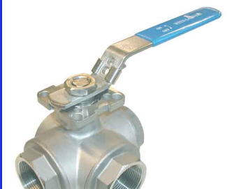
RVS 316 gereduceerde doorlaat fig 186 : L-boring 1/4"-2 1/2" bsp fig 187 : T-boring 1/4"-2 1/2" bsp hendel met grendel voorzien van iso 5211-top flens voor rechtstreekse montage