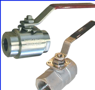
RVS 316 volle doorlaat fig 171SUN : PN100/40 1/4"-2" bsp fig 171SUN NPT : PN100/40 1/4"-2" npt fig 171 SUN MF : PN100/40 1/4"-2" npt fig 172 : PN420-PN210-PN100-PN64 bsp-npt-BW-SW aansluitingen fire-safe