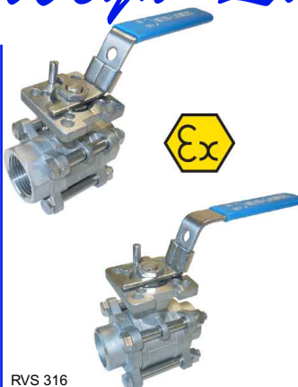
RVS 316 3-delig - volle doorlaat - iso 5211-top flens fig 177T : PN63/40 1/4"-4" bsp fig 178T : PN63/40 1/4"-4" BW fig 178T SW : PN63/40 1/4"-4" SW