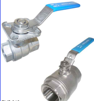
RVS 316 2-delig - volle doorlaat - PN63/16 - 180°C fig 171 : volle doorlaat PN63/16 1/4"-4" bsp fig 171G IT :volle doorlaat PN63 1/4"-3" bsp voorzien van iso 5211-top flens voor rechtstreekse montage